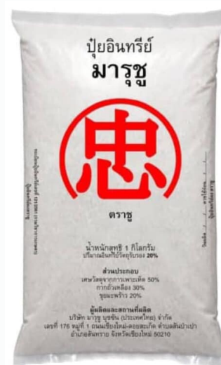
Takumi Fish Amino ( 1 litter) Chu Fertilizer 1kg NinjaKick Bloombooster 1kg