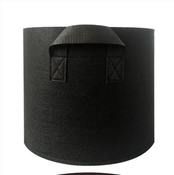
Geotextile Pot (white) 5 Gallons