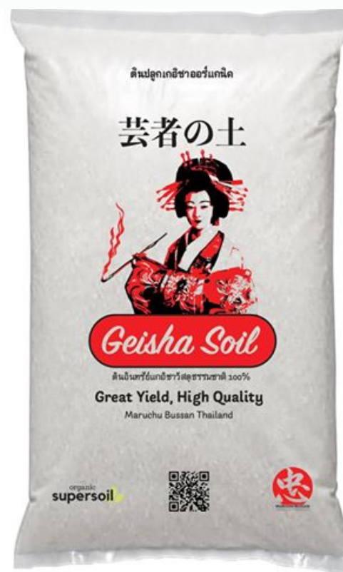
Geisha Premium Soil *Minerals are included 10KG